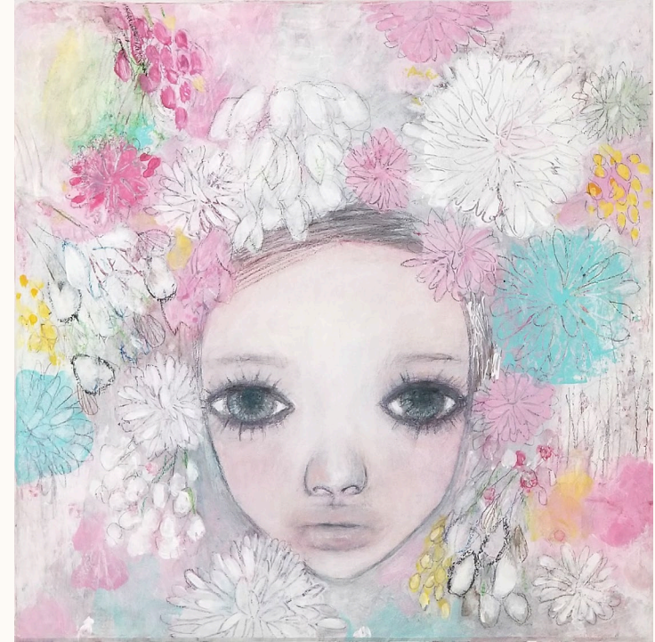
The Woman Who Wanted to Be a Flower